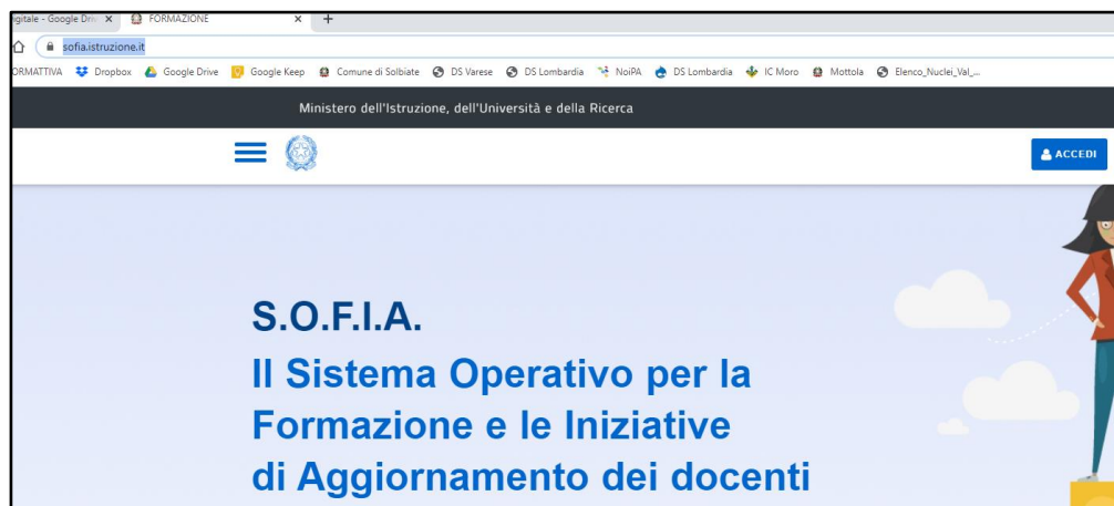
Figura 1 - home page di Sofia

Cliccare su "ACCEDI" (in alto a destra). Compare la pagina di autenticazione: